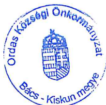
Zsigmond Enikő jkv.hit.